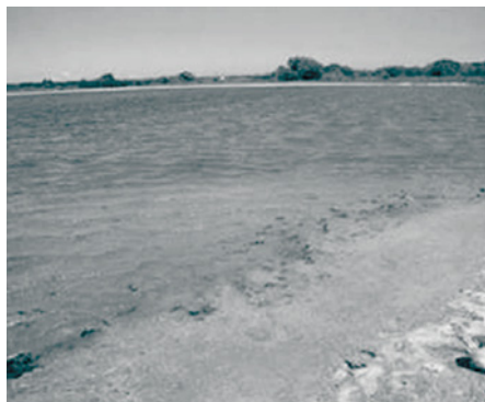
Figura 1 Vista do ponto 3 da Lagoa Pitanguinha com esteiras microbianas submersas.

sendo averiguado o diâmetro dos filamentos, diâmetro das colônias, diâmetro dos tricomas, espessura das bainhas, comprimento e largura das células, obtendo-se os valores médios, mínimos e máximos. O enquadramento taxonômico das cianobactérias seguiu os sistemas de Anagnostidis & Komárek (1988), Komárek & Anagnostidis (1999) e Prescott (1975).